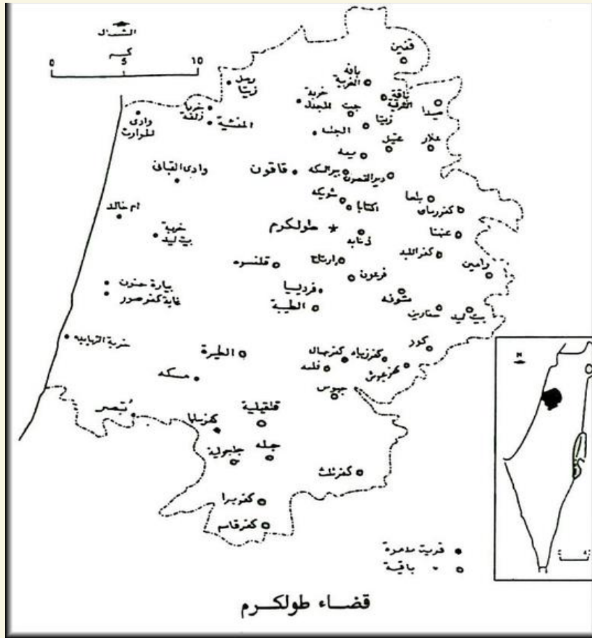
خارطة رقم (2): طولكرم قبل نكبة فلسطين عام 1948.

إثر حرب عام 1967، سقطت المحافظة في يد قوات الاحتلال، التي استهدفتها من جديد بالاستيطان ومصادرة الأراضي، كما فصلت قوات الاحتلال مدينة قلقيلية والقرى المجاورة لها، عن محافظة طولكرم، حيث حولتها إلى مركز إداري منفصل، لتتحول لاحقاً إلى محافظة جديدة.