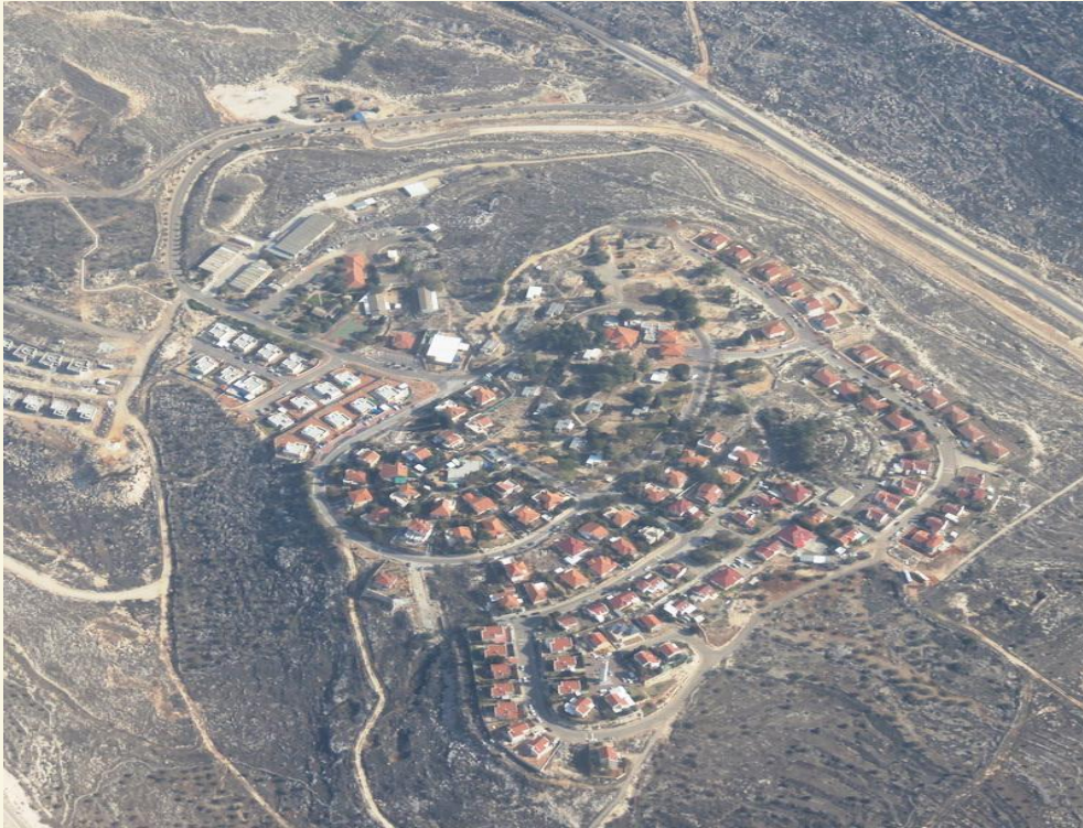
صورة رقم (3): مستوطنة عيناف.

هي مستوطنة دينية أقامتها منظمة "غوش إيمونيم" الاستيطانية عام 1981، على أراضي فلسطينية صادرة من قرى كفر اللبد ورامين وبيت ليد وعنبتا (العابد، 1986). وتقع هذه المستوطنة في الجهة الشرقية لمحافظة طولكرم، وتبعد عن مدينة طولكرم حوالي 10 كم، كما أنها تقع شرق الجدار الفاصل، وتتبع لمجلس شمران الإقليمي. تبلغ مساحتها حوالي 975 دونماً، فيما تبلغ مساحة مخططها الهيكلي 1566 دونماً (أريج ، 2018). ويبلغ عدد سكانها 975 مستوطنًا (Katz, 2020)، كما يبلغ عدد مبانيها 219 مبنى (The Washington Institute, 2019)، وتوجد بالقرب من هذه المستوطنة بؤرة استيطانية تم إنشاؤها عام 2002، وهي "كرمي دورون". تشكل "عيناف" مع مستوطنة "أفني حيفتس"، طوقا عسكريا على مدينة طولكرم من جهتي الشرق والجنوب، كما أنها تتصل بالخط الأخضر عبر شارع التفافي طوله 12 كم، تم شقه على حساب أراضي قرى شوفة وسفارين وبيت ليد ورامين، وتعتبر المناطق الجانبية على طول هذا الشارع مناطق عسكرية، بذريعة استعمالها كارتداد أمني.