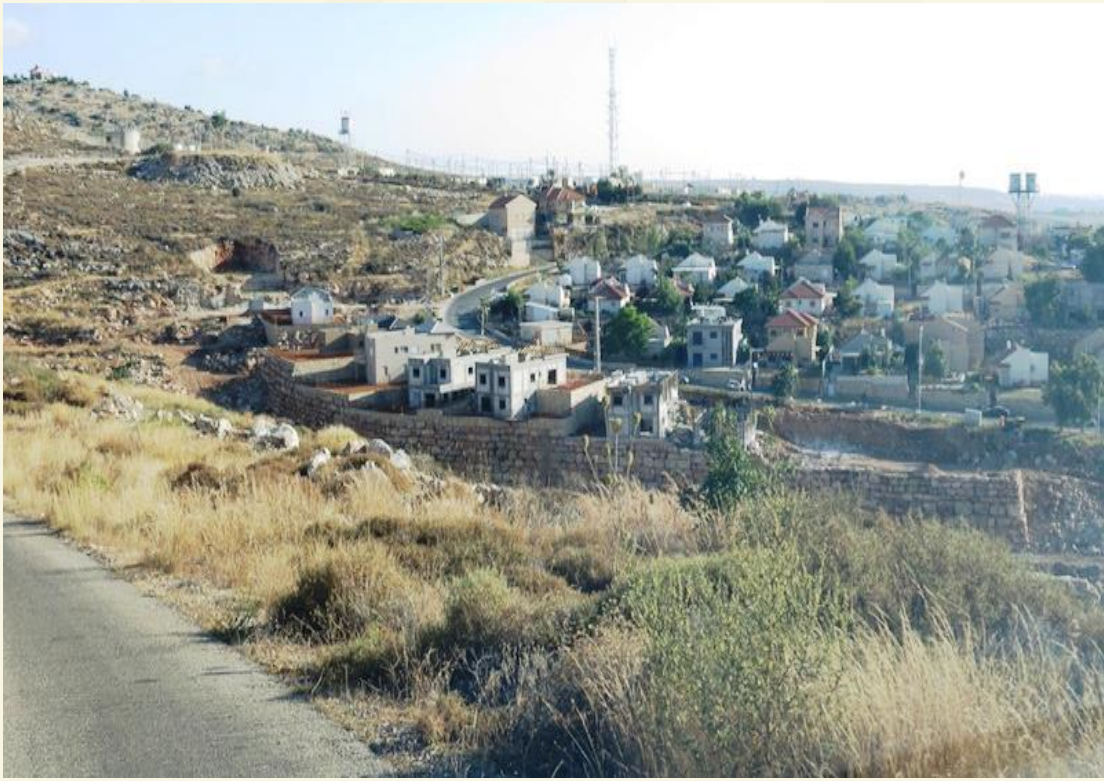
صورة رقم (1): مستوطنة أفني حيفتس.

الساحل الفلسطيني، وقد أدى وجود هذه المستوطنة في قلب القرى الفلسطينية شرق الجدار الفاصل، إلى شق طرق التفاقية لربطها بالمستوطنات الأخرى وبالداخل الفلسطيني، حيث ابتلعت هذه الطرق مساحات كبيرة من الأراضي الزراعية الفلسطينية. تطورت هذه المستوطنة بسرعة، فقد بدأت بـ 12 بيتا متقلا، لتتوالى بعدها عمليات توسيع المستوطنة، وبالذات بعد عام 2000 عندما اندلعت انتفاضة الأقصى، حيث استخدم الاحتلال المستوطنة كقاعدة انطلاق عسكرية للدبابات والآليات العسكرية باتجاه المدن والبلدات الفلسطينية، ويبلغ عدد المباني الاستيطانية فيها حاليا 294 مبنى (The Washington Institute, 2019).