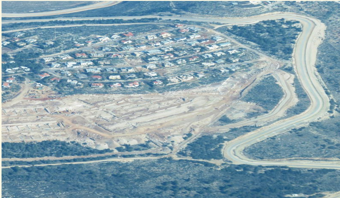
صورة رقم (2): مستوطنة سلعيت.

يعني اسم المستوطنة (سلعيت) العبري باللغة العربية "الصخر"، وهي محاولة لسرقة ذاكرة المكان عبر إطلاق أسماء عبرية عليها. واقتصاد المستوطنة قائم على تربية الدجاج، وقد أدى وجودها إلى عزل 4000 دونم لأهالي قرية كفر صور، وذلك بعد بناء جدار الفصل عام 2002، حيث أقام الاحتلال بوابة زراعية واحدة لعبور المزارعين منها إلى هذه الأراضي، وتفتح البوابة في مواسم محددة ولفترات قصيرة كموسم قطف الزيتون، ويتكبد المزارعون عناءً كبيراً للدخول إلى أراضيهم، كما قام المستوطنون بشق طريق من أراضي كفر صور لربط المستوطنة بالداخل الفلسطيني بطول 2 كم وعرض 20 متراً، ثم أقاموا شبكة صرف صحي للمستوطنة تصبّ المياه العادمة في أراضي كفر صور (مركز أبحاث الأراضي، 2015).