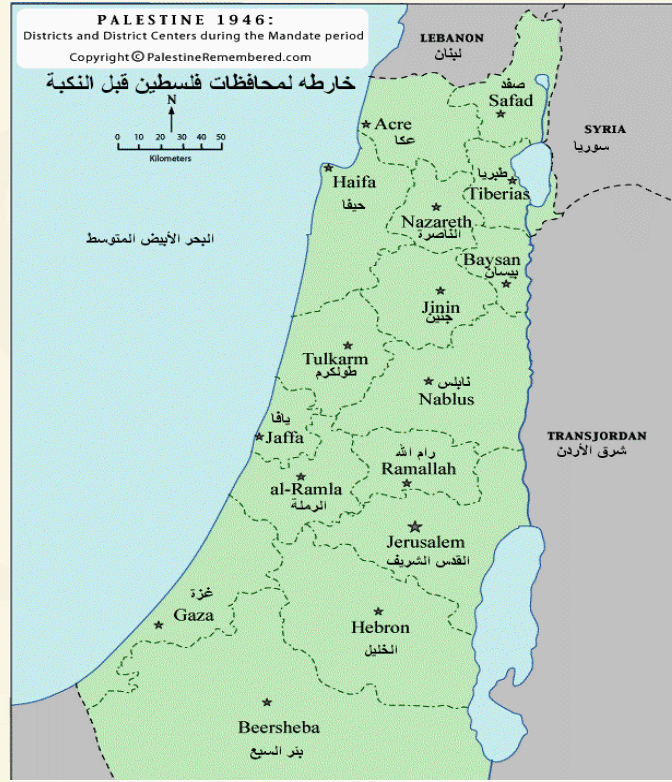
خارطة رقم (3): محافظات فلسطين قبل نكبة عام 1948