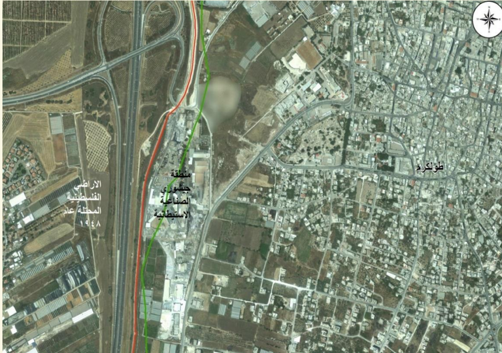
صورة رقم (4): المنطقة الصناعية الاستيطانية (جيشوري).

ولهذه المصانع تأثير كبير على البيئة المحيطة بها، فقد ازدادت معدلات الأمراض التنفسية بين الفلسطينيين بصورة كبيرة، كما أن مساحات كبيرة من أراضي المواطنين الزراعية، تضررت وتدمرت بسبب الأبخرة السامة والغبار والمياه العادمة، التي تنتجها هذه المصانع (دغلس، 2014).